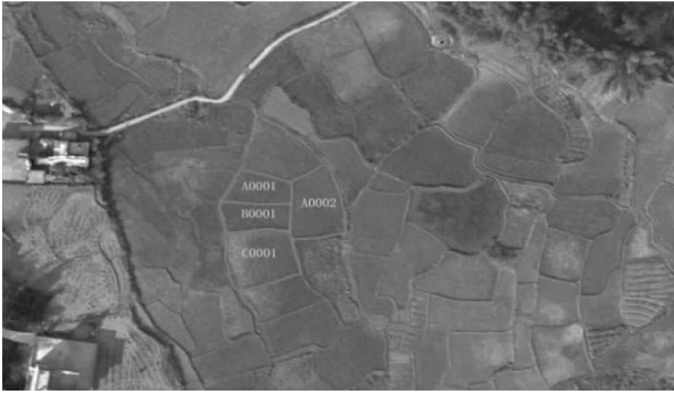
图2 外调底图画图规范

地为多年未耕作而丢弃的承包地,属于确权范围。确权工作中了解到龙川县有 2/3 的土地存在田埂轮廓模糊的问题,在航拍影像图上客观存在无法精准判断农户承包地的具体位置和界址轮廓(图3)。为保证农户的合法权益,确保土地确权工作的顺利进行,工作组成员提供一份承包地范围和总面积资料给经济合作社发包方代表,由村干部监督,所有承包方代表以商讨和表决的形式做出确权方案。一是对田埂轮廓模糊地较多、每户承包地面积不同的,按照二轮承包台账当时(1984年)各农户家庭分田人口数平均分配确权;二是对田埂轮廓模糊地较少、每户承包地面积相当的,统一确权到经济合作社公有。为了确保其公正、公开、透明化,要求承包方代表在确权表决书上签字按指模予以确认,经济合作社成员 2/3 以上确认无异议后再进行确权,若有异议,则该经济合作社暂缓田埂轮廓模糊地确权。